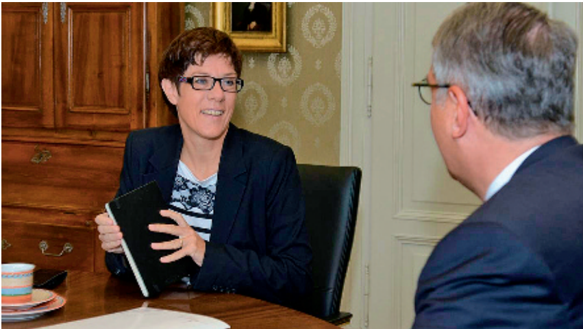
Auf dem Programm des Besuchs der Ministerpräsidentin in Speyer standen ebenfalls die Besichtigung der Gedächtniskirche der Protestation sowie der Dreifaltigkeitskirche.

Die Stärken des staatlichen und kirchlichen Föderalismus' haben die saarländische Ministerpräsidentin Annegret Kramp-Karrenbauer und der pfälzische Kirchenpräsident Christian Schad betont. Bei einem Gespräch im Landeskirchenrat in Speyer erklärten Kramp-Karrenbauer und Schad, dass die Bundesländer und Landeskirchen die unterschiedliche Geschichte und Kultur bewahrten und damit auch die regionale Identität stärkten. „Bürgernähe und Transparenz gelingen in kleinen Einheiten besser“, sagten die Ministerpräsidentin und der Kirchenpräsident. Ein zukunftsweisender Föderalismus sei sich aber immer der Verantwortung für das Ganze bewusst.