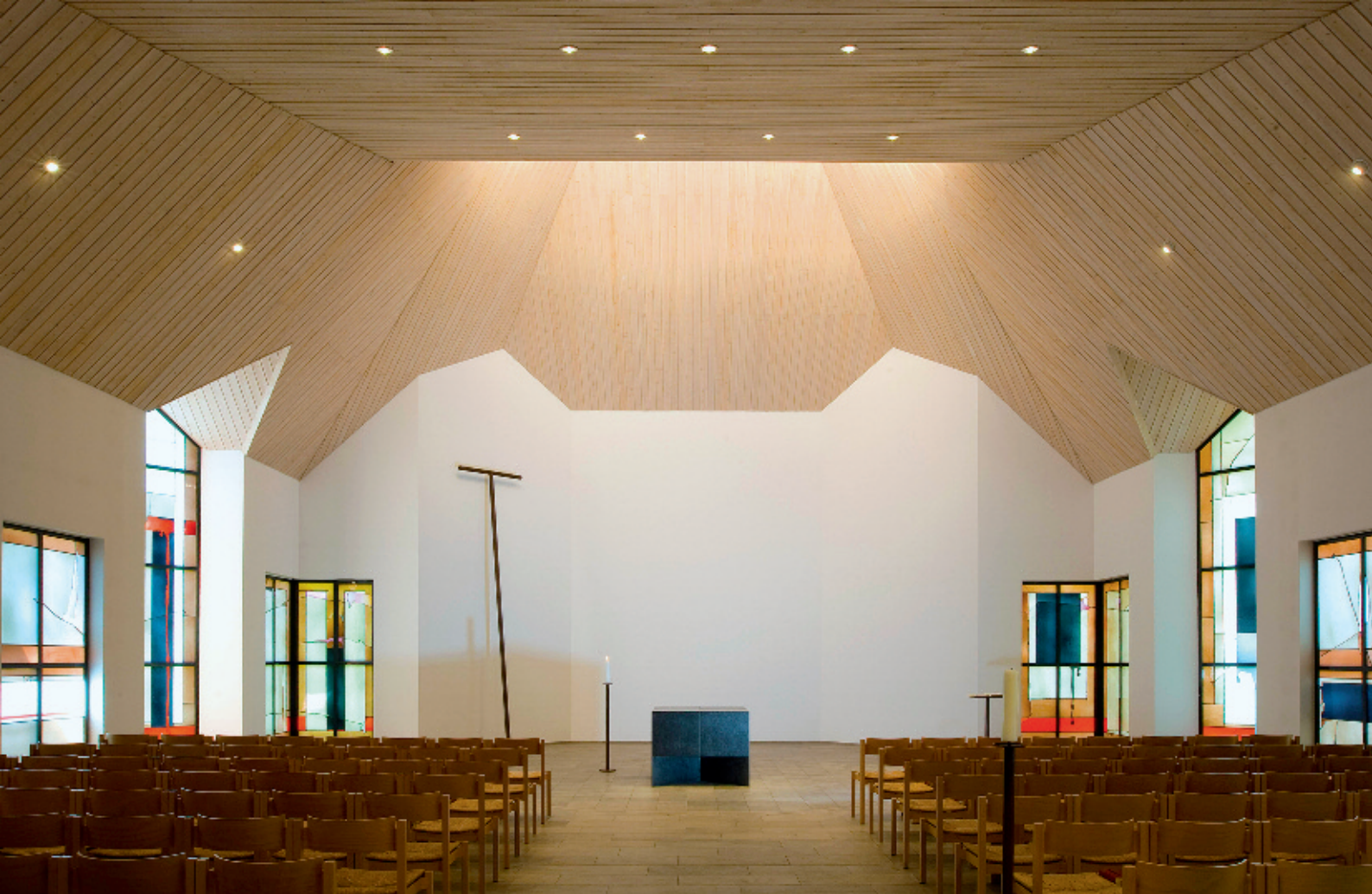
Beispiel für künstlerische Gestaltung einer Kirche: Glasfenster und Altar verleihen nüchternem Zweckbau neue Würde.