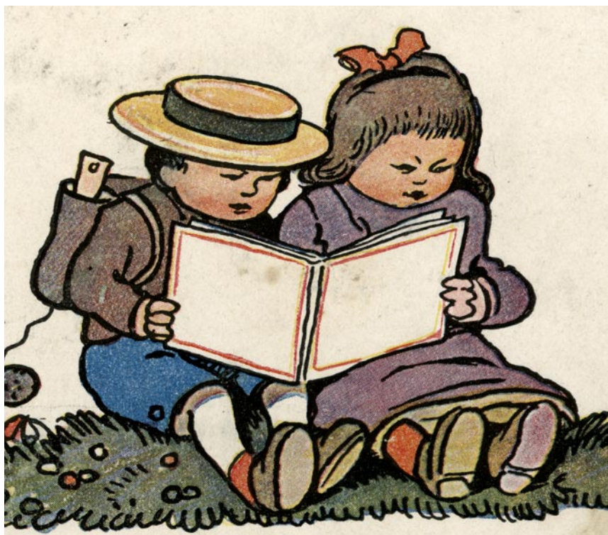
Aus der „Fibel für pfälzische Volksschulen“, 1913.

Das Programm des Zentralarchivs der Evangelischen Kirche der Pfalz für Lesekurse alter Handschriften 2020 liegt jetzt vor. Ab 2. März können Schriftinteressierte sich im Entziffern üben. Texte mit unterschiedlichen Schwierigkeitsgraden aus dem 18. und 19. Jahrhundert werden an fünf Abenden angeboten.