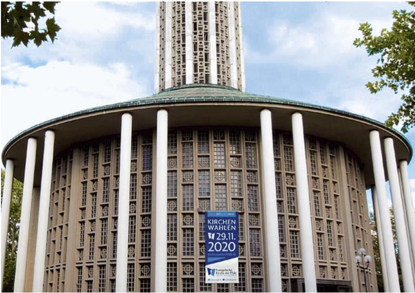
Beispiel: Werbebanner an der Ludwigshafener Friedenskirche.