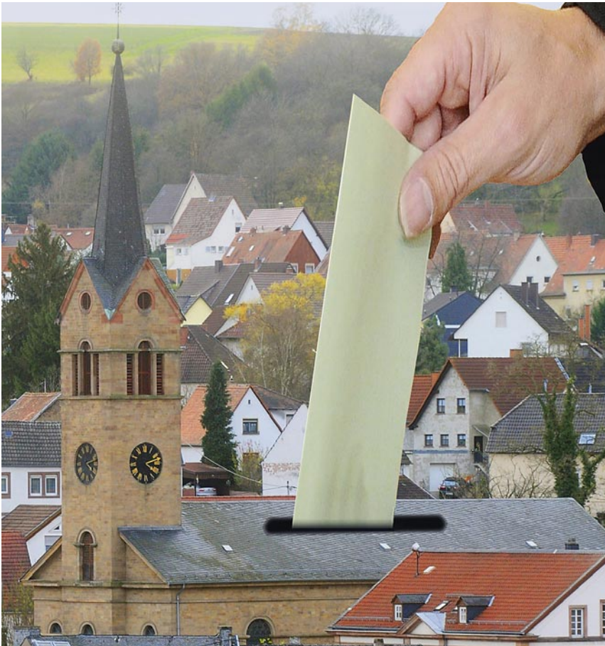
Wahlen zum Presbyterium: Gelebte Demokratie in der Kirchengemeinde.