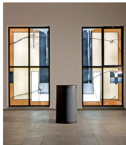
Räume gestalten: Fenster und Taufstein in der Christuskirche St. Ingbert.

Anmeldung unter: 06232 667-194/286 oder zentralarchiv@evkirchepfalz.de . Das gesamte Angebot liegt im Archiv als Faltblatt vor oder kann unter www.zentralarchiv-speyer.de auch heruntergeladen werden. https://www.zentralarchiv-speyer.de/service/lesekurse/ .