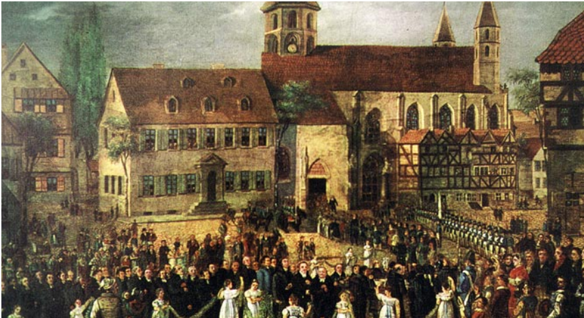
Presbyteramt erlangt Verfassungsrang: Zug der Generalsynode am 2. August 1818 zur Stiftskirche in Kaiserslautern. Historienbild von Theodor Veil (1787–1856); 1824/1825, Speyer, Dreifaltigkeitskirche.

Das Amt des Presbyters gibt es schon, seit es die christliche Kirche gibt. Allerdings wurden in den unterschiedlichen Phasen der Kirchengeschichte verschiedene Dienste mit dem Wort Presbyter benannt. Presbyter als ehrenamtliche Gemeindeleiter leiten sich aus der Theologie des Genfer Reformators Johannes Calvin her, Presbyterien als Organe der Gemeindeleitung entstanden zeitgleich mit der modernen Demokratiebewegung.