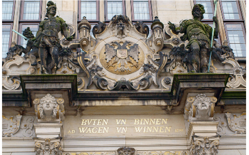
Der Schütting: Das Haus der Kaufleute.

Der St.-Petri-Dom bildet mit seiner über 1200-jährigen Geschichte den Mittelpunkt des protestantischen Lebens in Bremen. Etwa 1300 Sitzplätze bietet das Gotteshaus, und eine Besonderheit ist die Thomasmesse, die jeweils am letzten Sonntag eines Monats gefeiert wird. Der Name des Gottesdienstes erinnert an den Apostel, der auch als der ungläubige Thomas bekannt ist. Die Messe ist ökumenisch ausgerichtet und setzt ihre Schwerpunkte auf moderne Kirchenmusik und alternative Glaubensvermittlung. Neben dem Dom nimmt in der Bremer Kirchengeschichte die St.-Ansgarii-Kirche im Stadtteil Schwachhausen einen besonderen Platz ein. So hat dort am