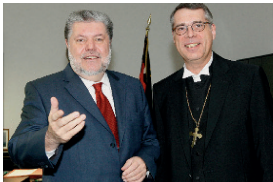
Meinungsaustausch: Kurt Beck und Christian Schad.

Die Kirchen sind für die Landesregierung wichtige Gesprächspartner, mit denen Vorschläge zur schnellen Umsetzung des Investitionsprogramms erörtert und abgestimmt werden.