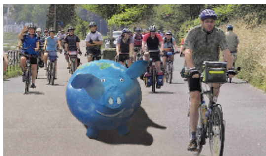
Fit in Sachen Sport und Spenden: „bike & help“-Tour 2009.

Bereits am 15. Mai startet unter dem Motto „bike & help“ eine Gruppe von 35 engagierten Radlerinnen und Radlern in Kaiserslautern zum Kirchentag. Die Teilnehmer werden die rund 650 Kilometer lange Radtour nach Bremen antreten und dabei für eine Aids-Selbsthilfe-Organisation in Südafrika in die Pedale treten. Die Tagesetappen liegen zwischen 50 und 130 Kilometern, Etappenziele sind Frankfurt/Main, Marburg, Bad Driburg, Porta-Westfalica und Verden/Aller. Zum Start des DEKT gibt es am 20. Mai eine Sternfahrt aller mit dem Rad nach Bremen anreisenden Gruppen. (emd)